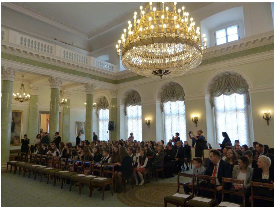
Podsumowanie Konkursu Mój Szkolny Kolega z Misji w Pałacu Prezydenckim - 21.04.2017 r.